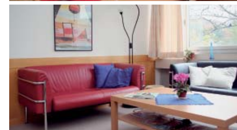
Leben in Wohngemeinschaft: die Psychotherapiestation für weibliche Jugendliche mit schweren Essstörungen.