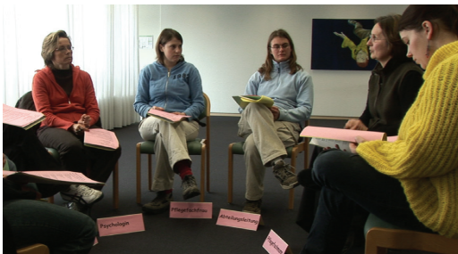
Rollenspiel einer Abteilungsversammlung mit Studierenden.

Ein Team aus verschiedenen Berufsgruppen deckt umfassende Behandlungsbereiche und Dienstleistungen ab: regelmässige Einzelgespräche bzw. -psychotherapie, Paar- und Familiengespräche, Milieuthherapie, Gruppentherapie, ärztliche Betreuung, medikamentöse Behandlung, Bezugspflege, Kunsttherapie, uvm.